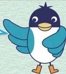
あんすこ君 あんしんすこやかセンター イメージキャラクター