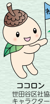
ココロン 世田谷区社協 キャラクター