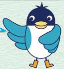
あんすこ君 あんしんすこやかセンター イメージキャラクター