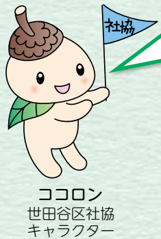
ココロン 世田谷区社協 キャラクター