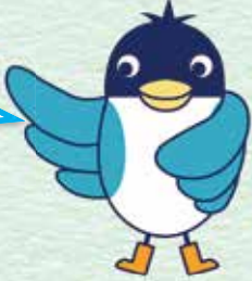
あんすこ君 あんしんすこやかセンター イメージキャラクター