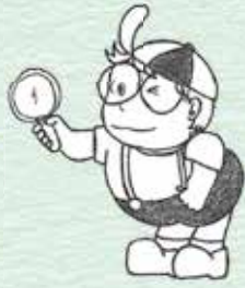
ひびきちゃん ミニコミ紙「砧のひびき」 イメージキャラクター