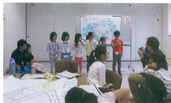
発表タイム！ 何が見つかったかな？