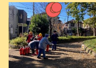
豪徳寺二丁目町会防災訓練 11月24日 実施