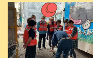
豪徳寺1丁目山下自治会防災訓練 10月22日 実施