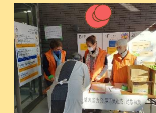
梅丘1丁目町会防災訓練 11月25日 実施