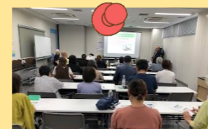
代田自治会ペット防災学習会 9月28日 実施