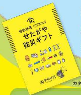
カタログイメージ