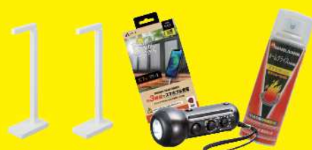
家具転倒防止器具・充電器・ラジオ・消火用品