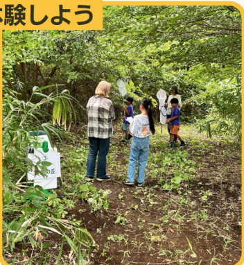
五感で楽しもう緑地 散策スタンプラリー