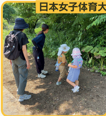
自然あそびゲーム