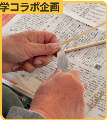
緑地の竹でマイ箸づくり