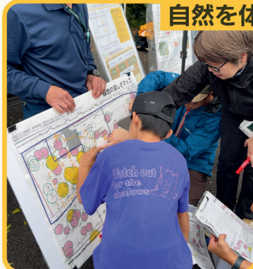
緑地の効果を調べよう