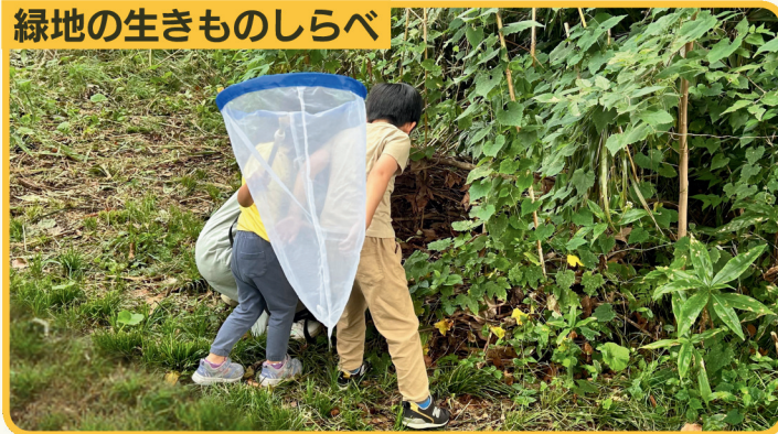
生きものの専門家に聞いてみよう