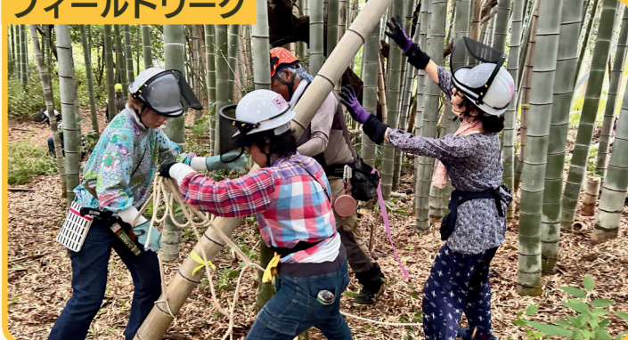
みんなで竹林を管理しよう

主催 世田谷区 みどり33推進担当部 問合せ先 公園整備利活用推進課 公園整備利活用推進担当 電話 03-6432-7911 FAX 03-6432-7989