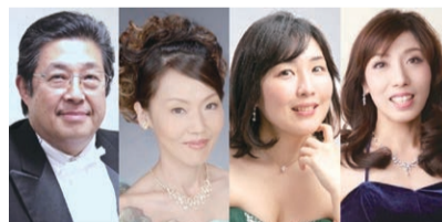
▲世代を問わず楽しめる夏の特別企画