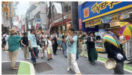
▲パレードの様子。ぜひ会場でご覧ください