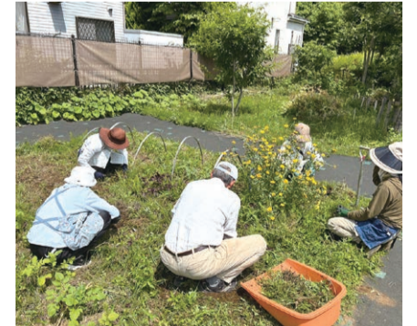
▲草刈りしながら楽しくおしゃべり