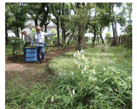
▲生きものが集まる明るい草地进行中