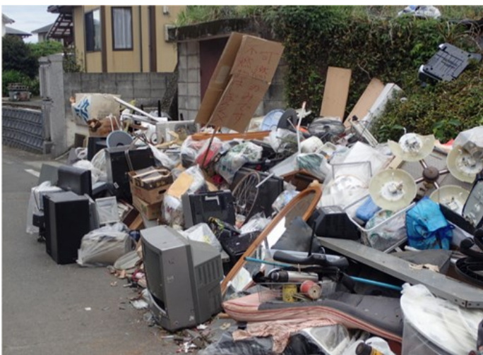
燃えるごみや粗大ごみが混廃化した様子