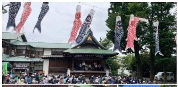
代沢芸術祭の様子（各日）

近所で楽しめる日替わりのコンサートとあつて年々人気が高まって、東京聖三一教会での弦楽四重奏は、来場者が会場に入りきれないほどでした。