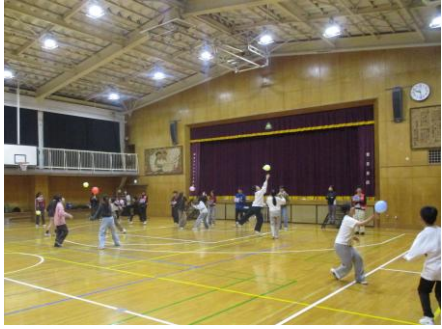
風船リレーの様子