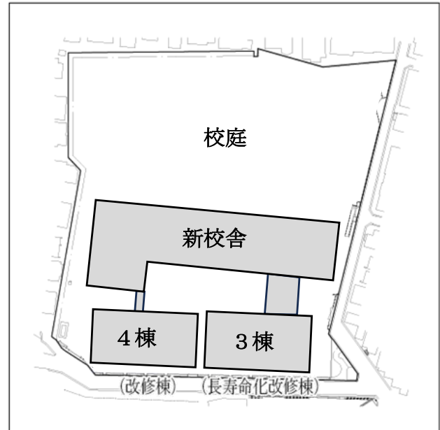
施設配置の整備イメージ