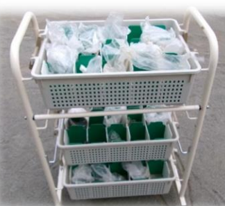
泥団子保管用ワゴン