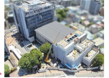
建設中の区役所本庁舎と区民会館

いただいた寄附金は、こうした家族をイベントへ招待したり、災害時の地域とのつながりを築いたりする取組みの支援に活用しています。