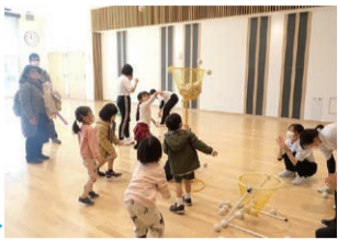
昨年メッセ「運動遊び」の様子▶