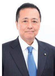
世田谷区長 のぶと 保坂展人

主な内容 ▶▶▶ 年末年始の資源・ごみ収集のお知らせ…2面 | 「緊急時バックアップセンター」をご活用ください…4面 | アウェアネスリボンをいくつか知っていますか?…6～7面