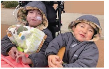
医療的ケア児ときょうだい