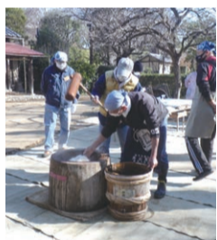
▲昨年の「餅つき」の様子

場・問 1 2 ②~④次大夫堀公園民家園 ☎ FAX 3417-8492、1 2 ①②④岡本公園民家園 ☎ FAX 3709-6959