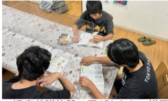
▲児童養護施設の子どもたちの様子

児童養護施設や里親等のもとを巣立った若者の自立支援に取り組んでいます。いただいた寄附金は、奨学金の給付、就職に役立つ資格等の取得費用の給付及びアパート等で一人暮らしをする退所者等への家賃の一部の給付に活用し、若者の安定した自立のための支援に役立っています。