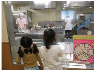
1歳クラスの給食場面