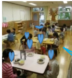
幼児クラス給食場面