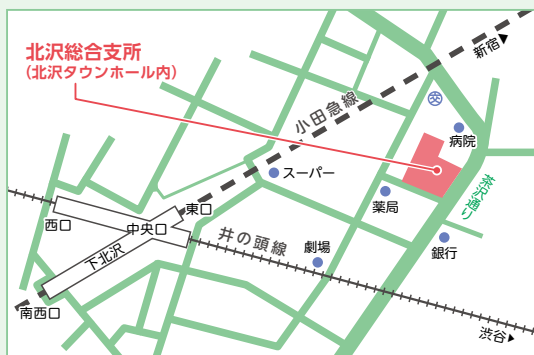
北沢2-8-18 (北沢タウンホール内)