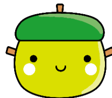
せたがや離乳食研究員 モグモ